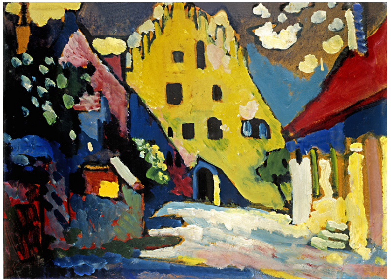
В.Кандинский, "Замок I", 1908 год

С творчеством этого замечательного художника - основоположника абстракционизма, теоретика и графика я была знакома давно, но мне захотелось узнать об этом человеке больше. И я не прогадала! Изучая и проникая глубже в биографию художника, я открыла для себя много нового и удивительного!